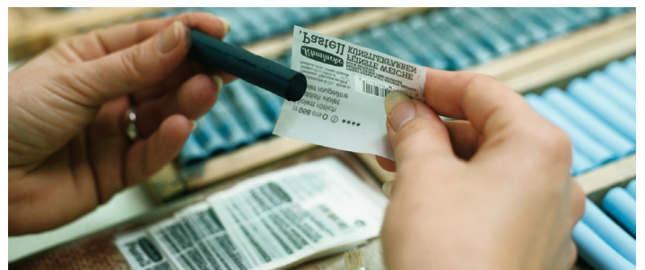
Handetikettierung der Schmincke Pastelle / Handlabelling of Schmincke pastels