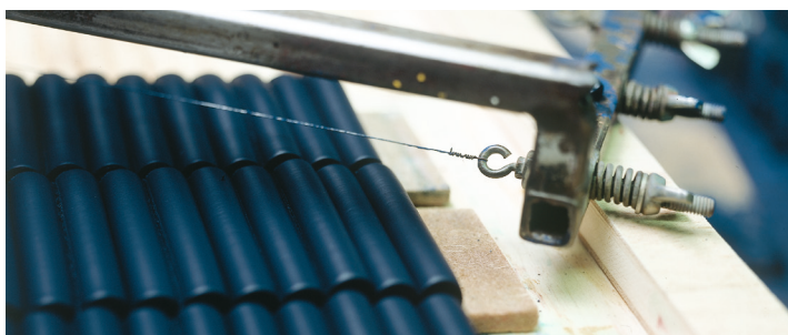
Pastelle werden mit einem drahtbespannten Rahmen zugeschnitten / Wire-strung frame for cutting the pastels