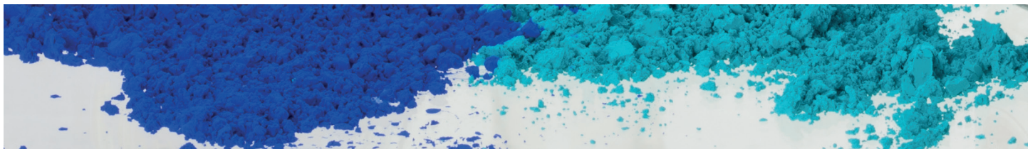
Feinste Künstler-Pigmente / Finest artists' pigments

Pastel paintings will always remain sensitive. Therefore, they should only be treated with a special fixative, like Schmincke Pastell-Fixativ (no 50 402), to be used sparingly.